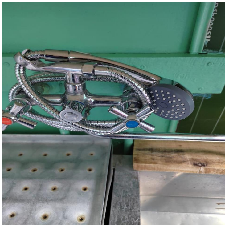
Ополаскивание столовой посуды