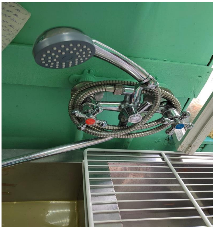
Мойка столовой посуды