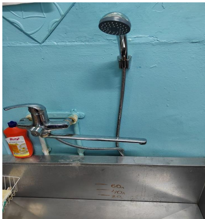
Мойка кухонной посуды