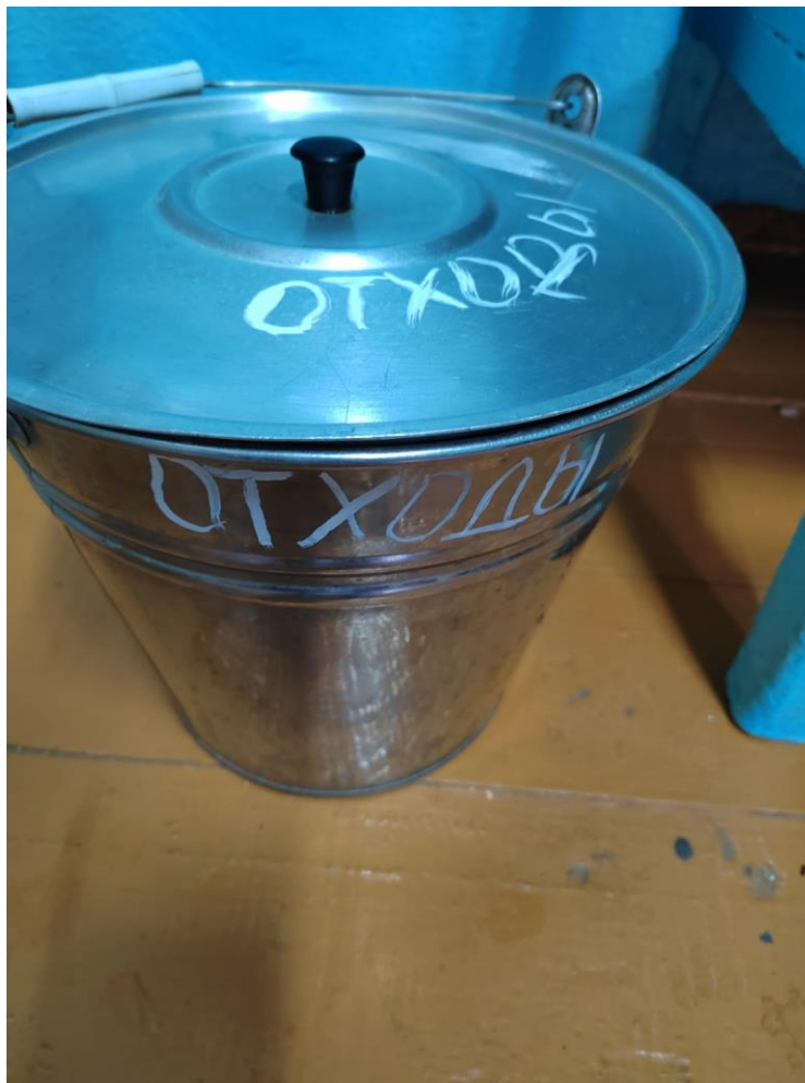
Замена маркировки «очистки» на «отходы», приобретена крышка