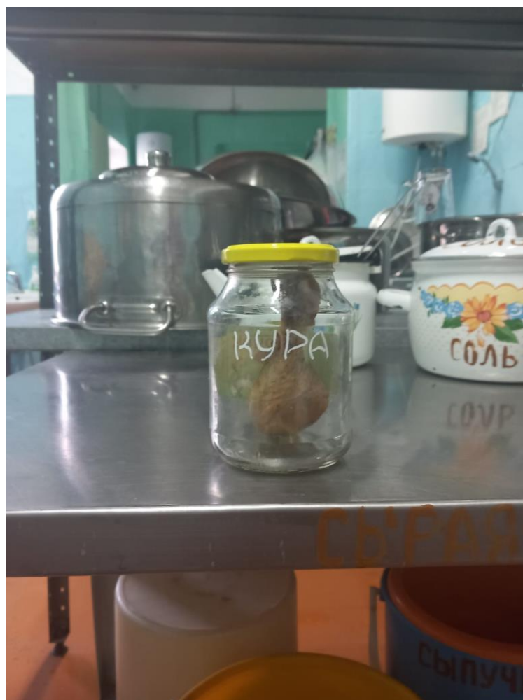
Замена ёмкости для 2 блюда с возможностью полного закрытия