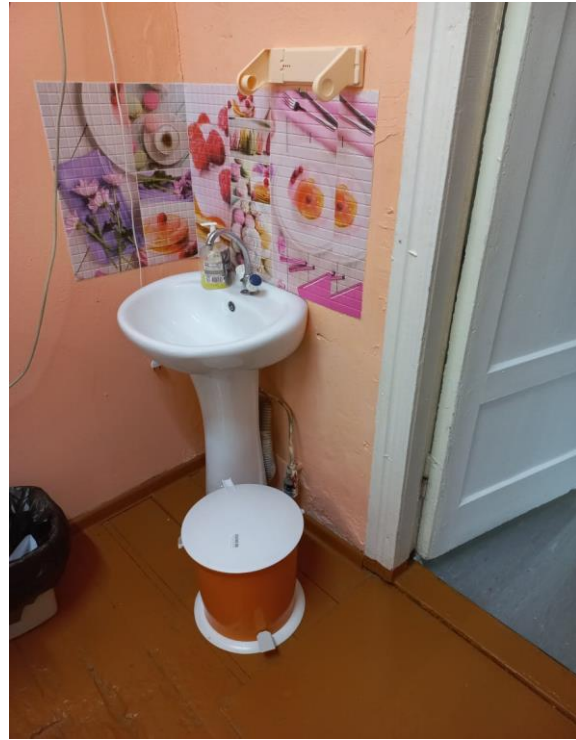
Кабинет психолога, логопеда