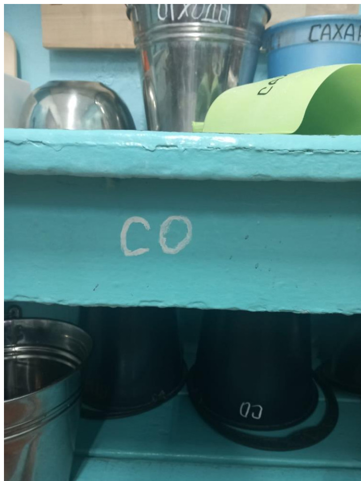
Маркировка стола «Сырые овощи»