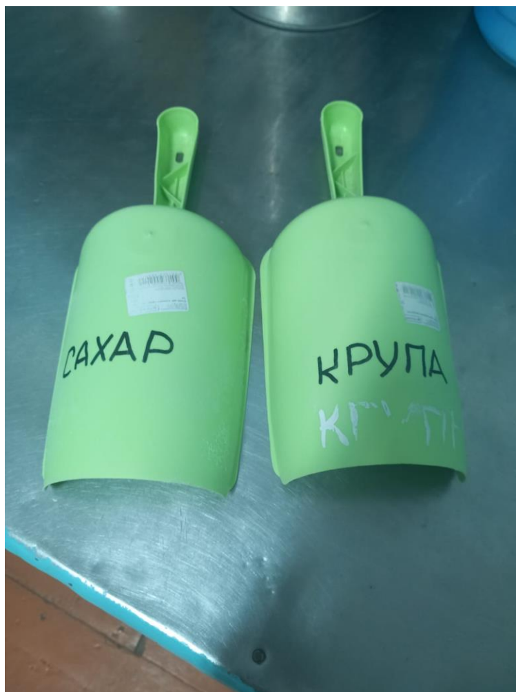
Маркировка совков для пищевых продуктов: «сахар», «крупа»