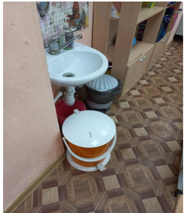
Замена неисправных вёдер в кабинетах № 5 и 12