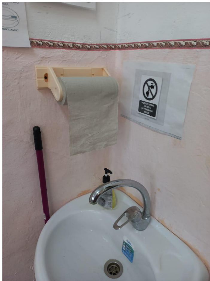
Полотенцедержатель в кабинете № 12