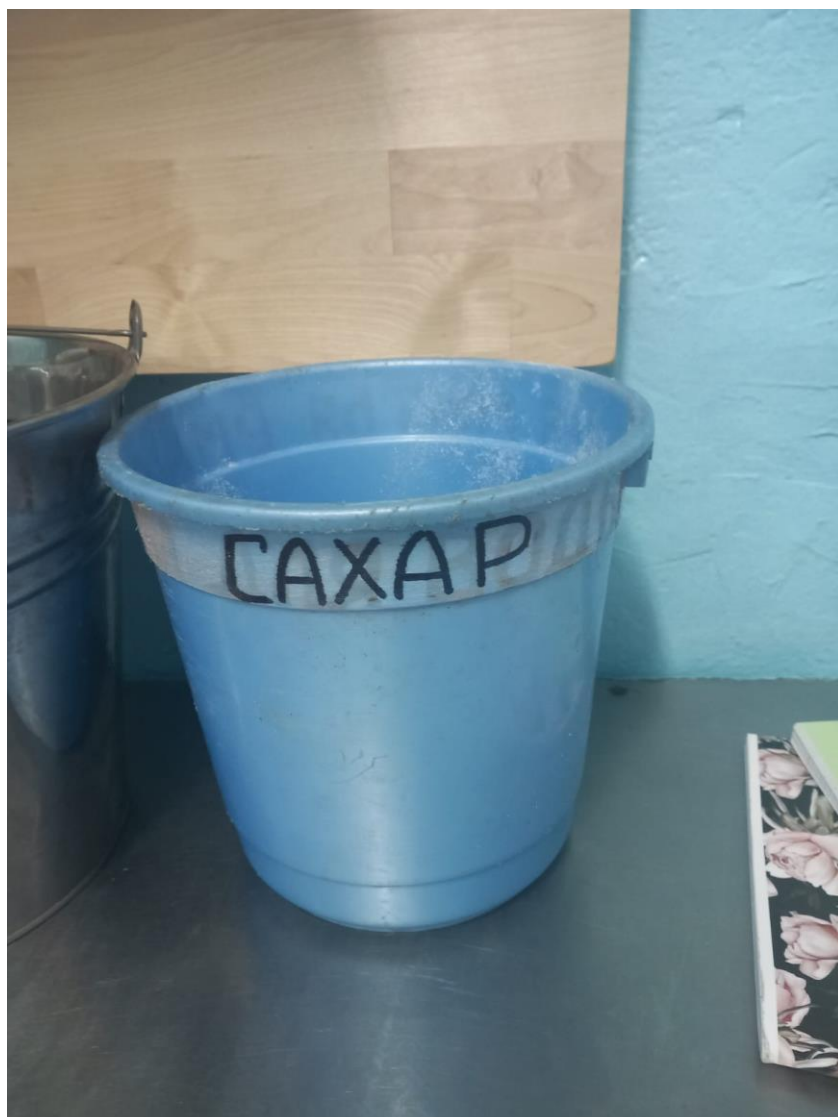
Маркировка на емкости «для воды» исправлена на «сахар»