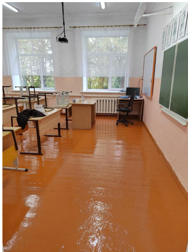
Кабинет № 7