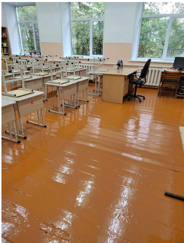
Кабинет № 6