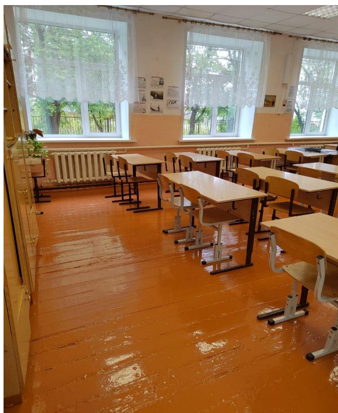
Кабинет № 8